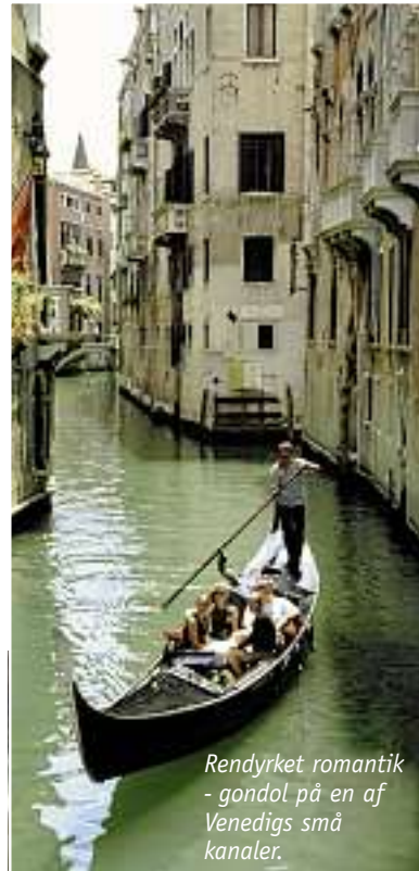
Rendyrket romantik - gondol på en af Venedigs små kanaler.

Man finder forholdsvis hurtigt ud af at færdes langs Venedigs virvar af større og mindre kanaler - og skulle man endelig fare vild, kigger man bare efter skiltene med 'Per Rialto' eller 'Per S. Marco'. Så er man snart blandt mennesker igen. Skal man over Canal Grande, og der ingen bro er i nærheden - dem er der ellers omkring 400 af - sejler der højst sandsynligt en traghetto,