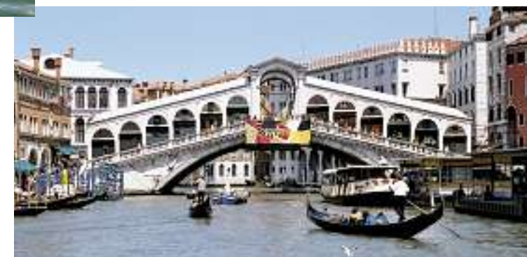
Rialtobroen blev bygget omkring 1590, for at man kunne komme over Canal Grande i det, der var, og stadig er byens største handelsområde. Lige indtil 1854 var broen den eneste bro over kanalen.

Sådan kom det imidlertid ikke til at gå. Trods de mange, mange tusinde medturister (hvor faren for at blive væk for hinanden absolut er til stede), trods de skyhøje priser på restauranter og cafeer, trods de pågående gadesælgere, trods de irriterende duer på Marcuspladsen - ja, så faldt vi pladask for byen, for stemningen, kort sagt: det hele... Vi blev fuldstændig grebet af den magi, som netop er Venedig, denne underlige by, hvis lige ikke findes noget sted på vores planet. Verdens største bilfri by. Da vi efter den første dag trætte kom hjem til Solifer'en på Miramare, var vi slet ikke klar til at vende hjem til Danmark, så vi blev hurtigt enige om, at her blev vi simpelthen nødt til at blive noget længere. Så næste morgen var det et 72 timers kort til færgen, vi købte i receptionen. Med denne billet til ca. 20,- euro i hånden fik vi ubegrænset adgang til alle ACTV's rutebåde, vaperetto'erne, færgerne osv. i hele Comune di Venezia, dvs. rundt i Venedigs kanaler samt rundt til