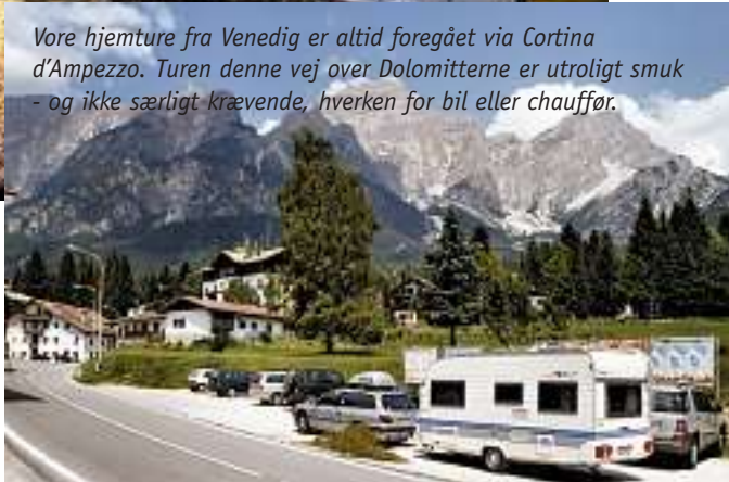
Vore hjemture fra Venedig er altid foregået via Cortina d'Ampezzo. Turen denne vej over Dolomitterne er utroligt smuk - og ikke særligt krævende, hverken for bil eller chauffør.

opleve det store karneval i februar til at gå i opfyldelse? Eller måske får vi mulighed for at se den store regatta, Regata Storica i september, hvor gondolierernes styrke og dygtighed sættes på en prøve. Sceneriet i sig selv skulle være et overdådigt orgie i farver og pragt.