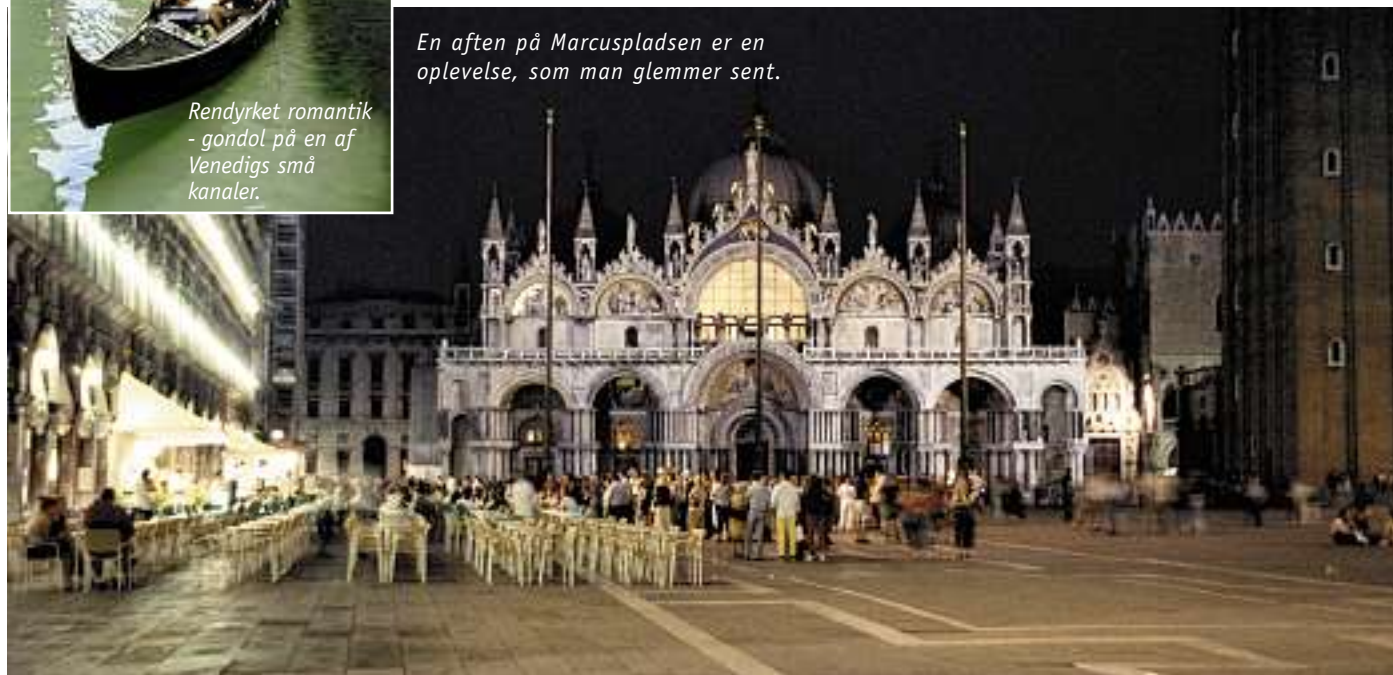
En aften på Marcuspladsen er en oplevelse, som man glemmer sent.

en smal båd, hvor man stående bliver færget over til den anden bred for næsten ingen penge. En enkelt morgen skal man prøve at stå tidligt op og tage ind og opleve den livlige aktivitet på Rialto-markedet. Man er ikke i tvivl, når man nærmer sig det enorme fiskemarked, som ligger lige ved Canal Grande - bare gå efter lugten! Her er simpelthen alt godt fra havet, fisk og skaldyr i alle afskygninger. Går man væk fra kanalen, kommer man til frugt-, grønt- og ostemarkedet. Det er noget af en oplevelse at se de entusiastiske, italienske husmødre og opkøberne fra hotellerne og restauranterne købe ind. Med kendermine bliver varerne vurderet - og så bli'r der naturligvis tinget om prisen, som siges sku' befinde sig i den dyre ende. Endelig er der en livlig handel med alt muligt andet - ikke mindst lædervarer med 'very special price for tourists'. Vi fik da også købt en enkelt taske, som vi i øvrigt har været meget glade for.