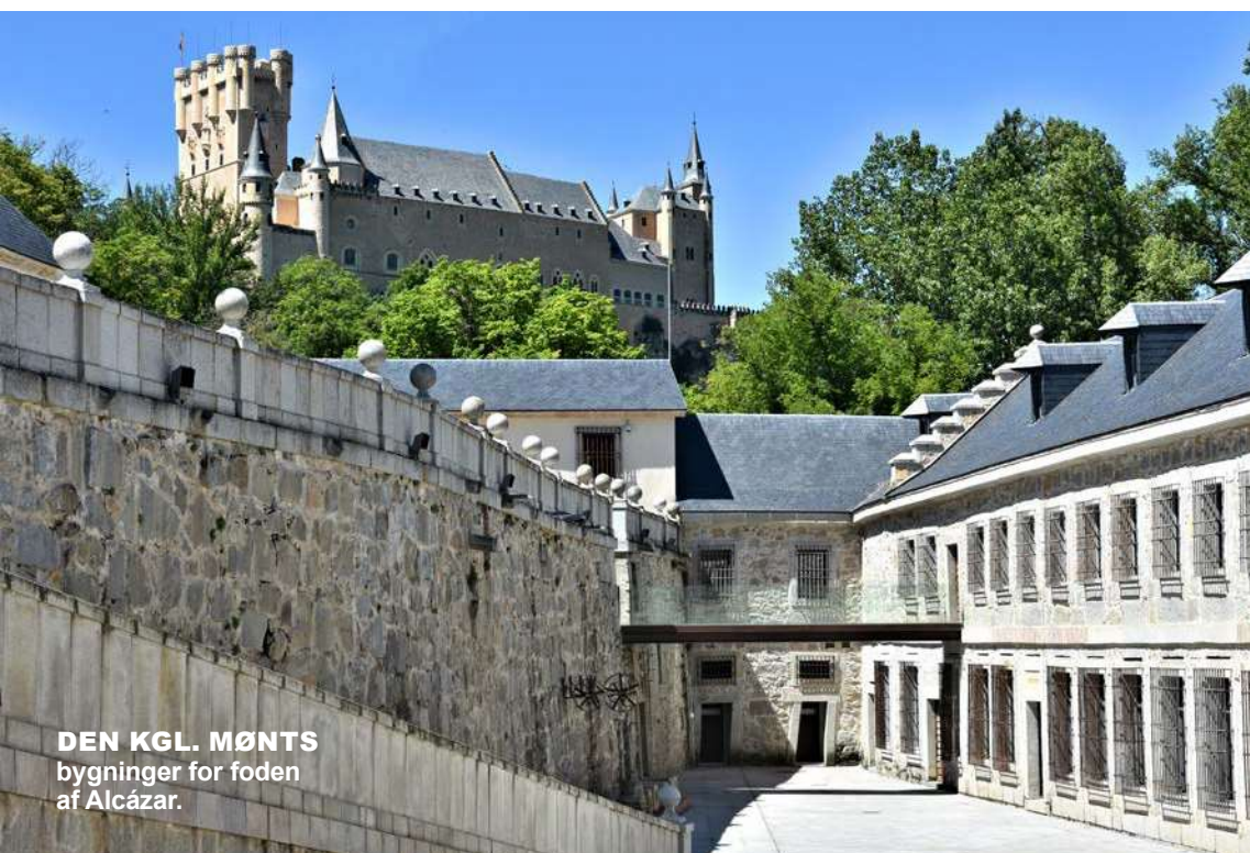
DEN KGL. MØNTS bygninger for foden af Alcázar.

Lige pludselig, mens vi kørte gennem et af hårnålesvingene, så vi mindre end 25 m fra vores bil en kridhvid hest med sit føl gå inde mellem træerne i et område med tæt skov. Da vi sagtnede farten, blev hesten meget vagtsom, trak lidt væk og placerede sig, så hun skærmede føllet. Jeg ville gerne ha' haft et billede af dem, men selvfølgelig lå kameraet omme bagest i bilen. Vi stoppede på den før-