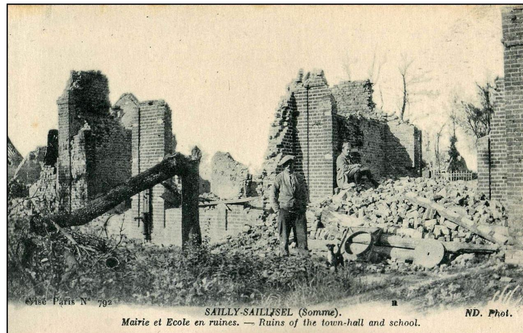
Postkort. Rådhuset og skolen i Sailly-Saillisel lagt i ruiner.