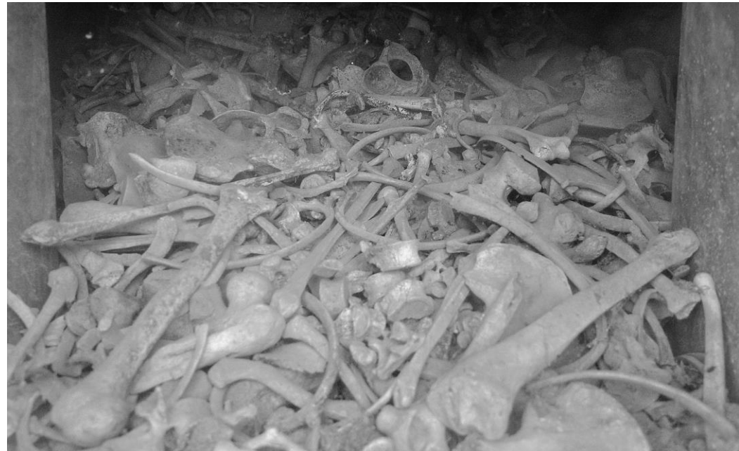
Gennem ruder i Benhusets væg kan man kigge ind til de store magasiner med indsamlede skeletrester.