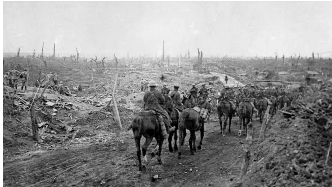
Britiske kavalerister rider 12. oktober 1916 gennem det, der engang var landsbyen Guillemont.