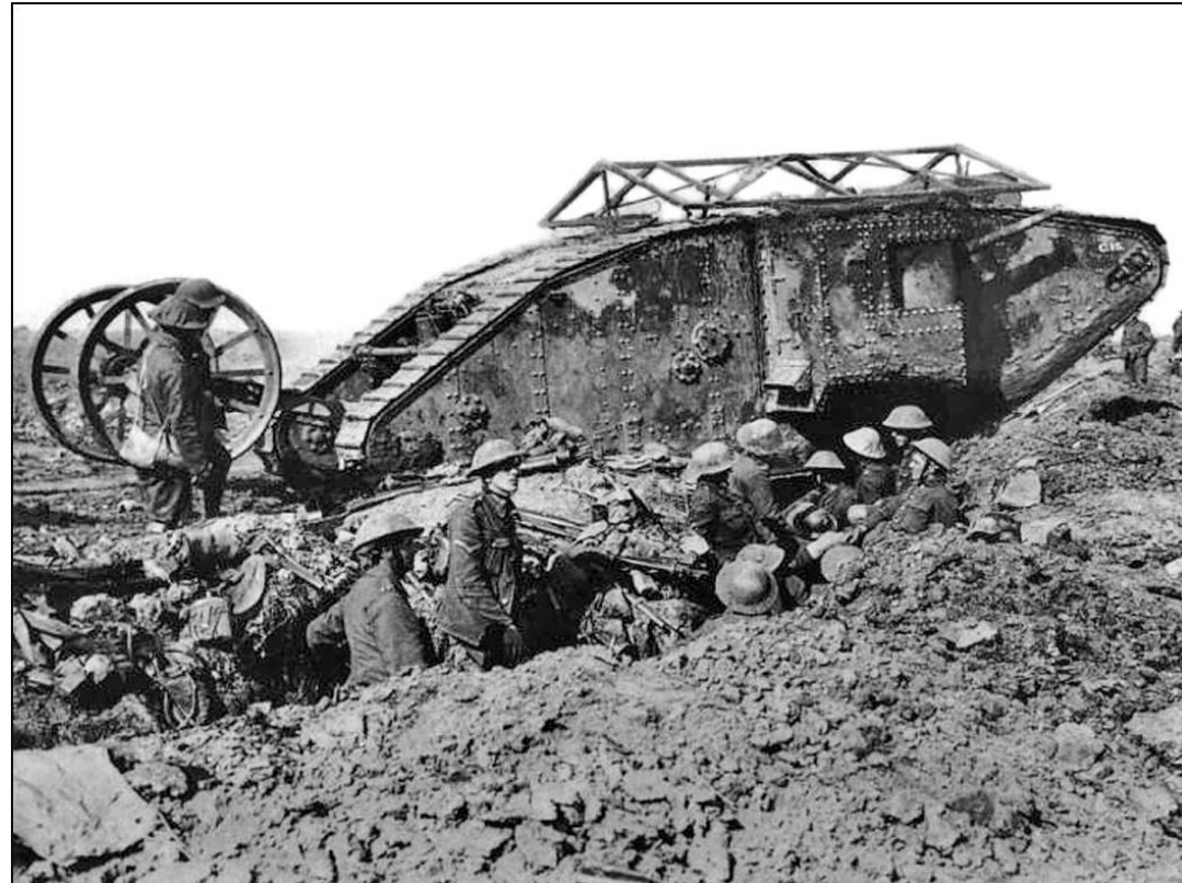
De første britiske kampvogne havde betegnelsen Mark I. De havde en besætning på 8 mand og vejede 28,4 tons. Foto fra 25. september 1916.