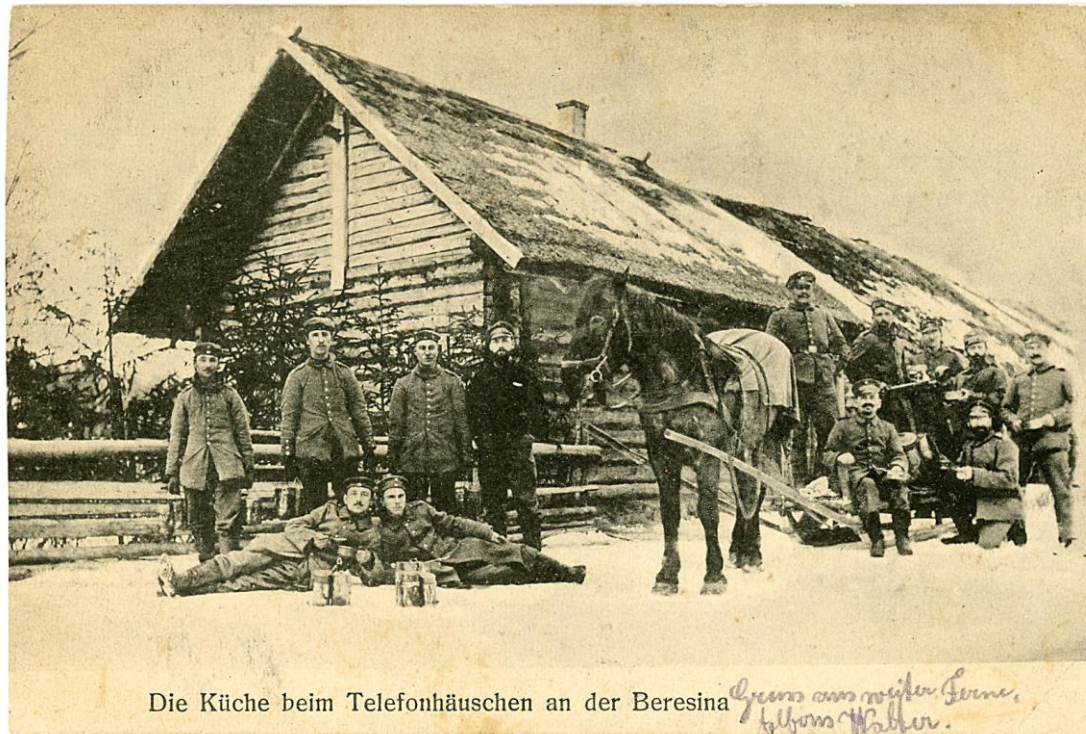
Feltpostkort fra oktober 1916