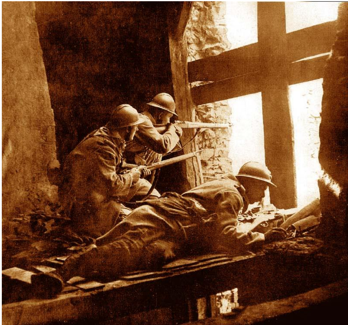
Flot billede fra Fremmedlegion-hjemmeside med teksten: 'Gadekampe i Belloy en Santerre juli 1916'. Billedet virker arrangeret!

Han blev såret ved Belloy en Santerre vest for Somme-floden og døde 11. juli af sine kvæstelser – blot 13 dage før sin 21 års fødselsdag. Ma-