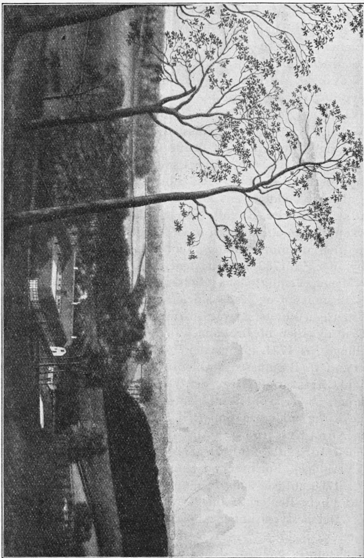
Udsigt fra Broholm Bjerg med Gaarden, som den saa ud for ca. 100 Aar siden.