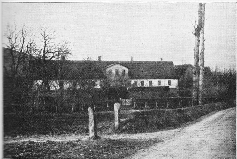
Broholm i Nutiden.