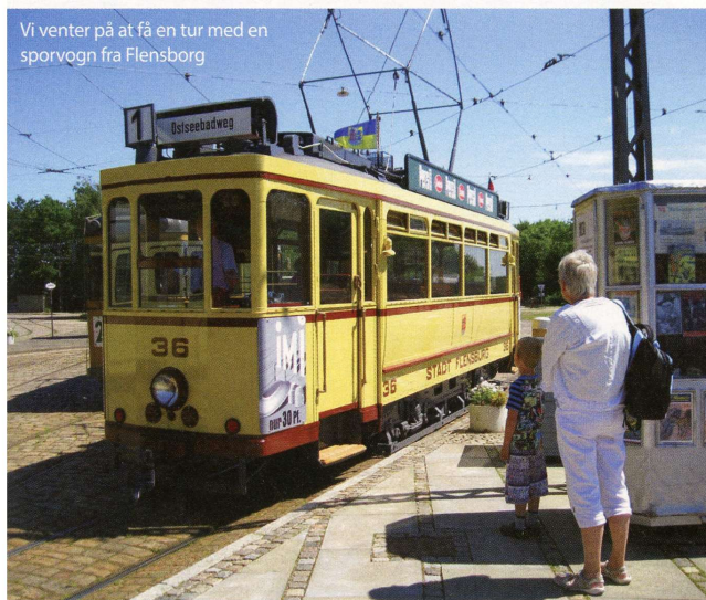
Vi venter på at få en tur med en sporvogn fra Flensborg