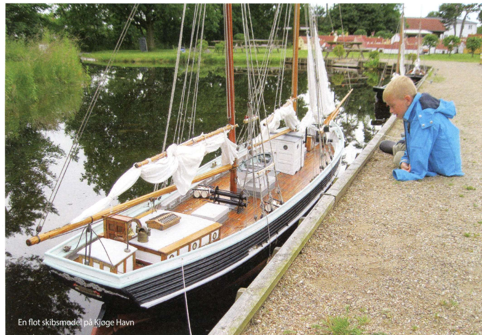
En flot skibsmodel på Kjøge Havn