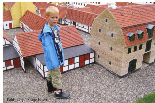
Pakhus på Kjøge Havn

Særligt var han meget optaget af, at man inde fra kirken kunne høre, at organisationen øvede sig. Inde på et af værkstederne, 'teglværket', fik han et par tagsten som souvenir. På 'snekkeriet' fik han et par vindu-