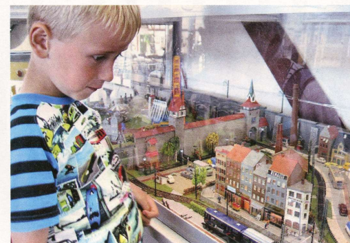
Sporvejsmuseets modelbane med tog og sporvogne er et hit hos en 6-årig gut.