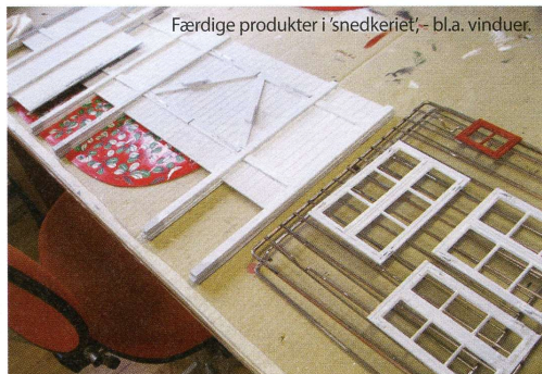
Færdige produkter i 'snedkeriet', - bla. vinduer.