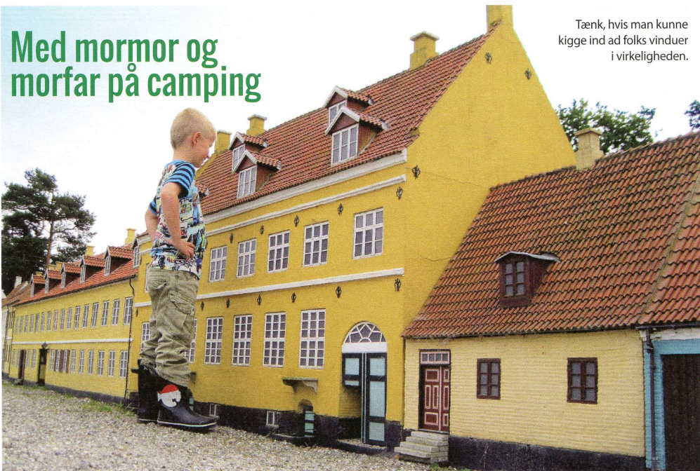
Tænk, hvis man kunne kigge ind ad folks vinduer i virkeligheden.