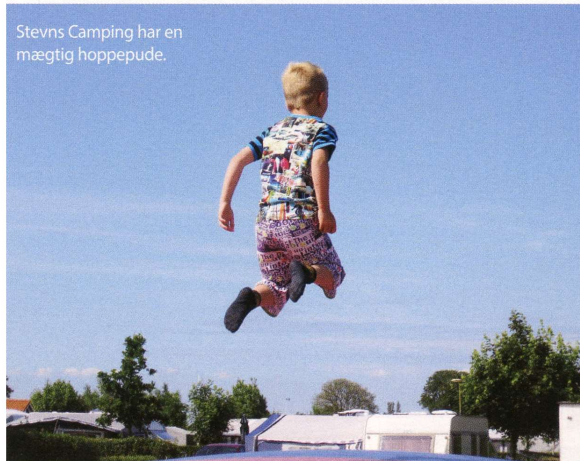
Stevns Camping har en mægtig hoppepude.