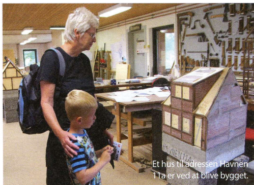
Et hus til adressen Havnen 11a er ved at blive bygget.