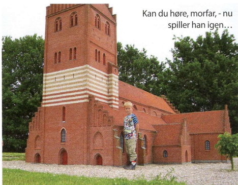
Kan du høre, morfar, - nu spiller han igen...